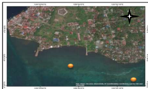
Gambar 1 Peta Kota Naira

Kecamatan Banda terdiri dari 12 pulau, dengan 7 pulau dihuni dan 5 pulau tidak dihuni. Pada Tahun 2015, Kecamatan Banda telah memiliki 18 Desa. Kecamatan Banda secara geografis terletak pada posisi : 5°43' - 6°31' Lintang Selatan dan 129°44' - 130°04' Bujur Timur dan dibatasi oleh: Selat Seram disebelah Utara, Kepulauan Teon Nila Serua disebelah Selatan, Laut Banda disebelah Timur, dan Laut Banda disebelah Barat ( Banda Dalam Angka , 2016:4)