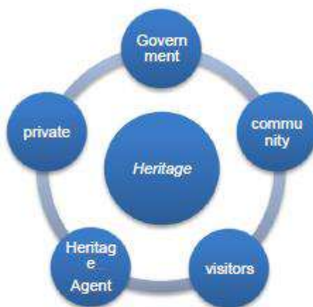
Gambar 4. Model Strategi Kolaboratif-Strategis

Kunci pertama dalam mengembangkan potensi wisata sejarah di Banda Naira adalah kolaborasi antara para pemangku kepentingan. Situs wisata sejarah di Banda memiliki potensi yang sangat menarik bagi wisatawan, namun belum dikembangkan karena komunikasi antar pemangku kepentingan yang terbatas. Semua pemangku kepentingan membutuhkan kesadaran bersama bahwa mengembangkan destinasi wisata di Banda membutuhkan kolaborasi. Setiap pemangku kepentingan memiliki peran dalam pengembangan wisata cagar budaya di Banda. Peran adalah aspek dinamis dari suatu posisi atau status. Jika seseorang menjalankan hak dan kewajibannya sesuai dengan posisi atau status itu, maka orang tersebut telah menjalankan peran tersebut (Suharto 2006).