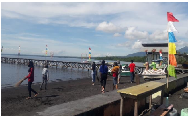
Gambar 2. Pemberdayaan Social Atau Bakti Sosial

Pemberdayaan social atau Bakti Sosial telah dilaksanakan pada tanggal, 9-10 Oktober 2020 yang dihadiri oleh Tim PKM, badan pengurus Bumdes, pemilik warung/kios. Memasuki era new normal, pariwisata pantai desa pitu dibuka Kembali sehingga perlu dalam kegiatan pengabdian kepada masyarakat dilakukan bakti social bersama yang bertujuan agar lingkungan wisata pantai lebih bersih, dan menarik wisatawan berkunjung. Manfaat yang bisa diperoleh dari laksanakan bakti social yaitu lingkungan lebih ASRI dan ketika wisatawan banyak berkunjung maka pendapatan ekonomi masyarakat, pengelola BUMDes dan pemilik warung bertambah dan meningkat. Sektor pariwisata menjadi salah satu bagian terpenting dalam meningkatkan ekonomi masyarakat Desa (Sanjaya, 2020). Masyarakat Desa wisata harus memahami pentingnya arti menjaga kualitas lingkungan sebelum pariwisata diperkenalkan di desa wisata (Suprina, 2020). Keberadaan desa di lingkungan bisnis pariwisata, idealnya dapat membantu desa tersebut ikut berkembang, warga desa dapat ikut sejahtera mengikuti perkembangan bisnis pariwisata (Ningrum, Harapan Pemuda Desa Pasir Angin sebagai bagian dari Bisnis Pariwisata di Lingkungan sekitar Desa, 2020).