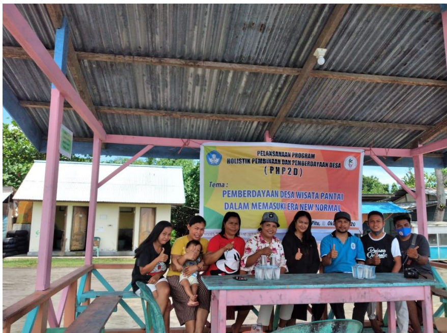
Gambar 1. Pendidikan sadar wisata