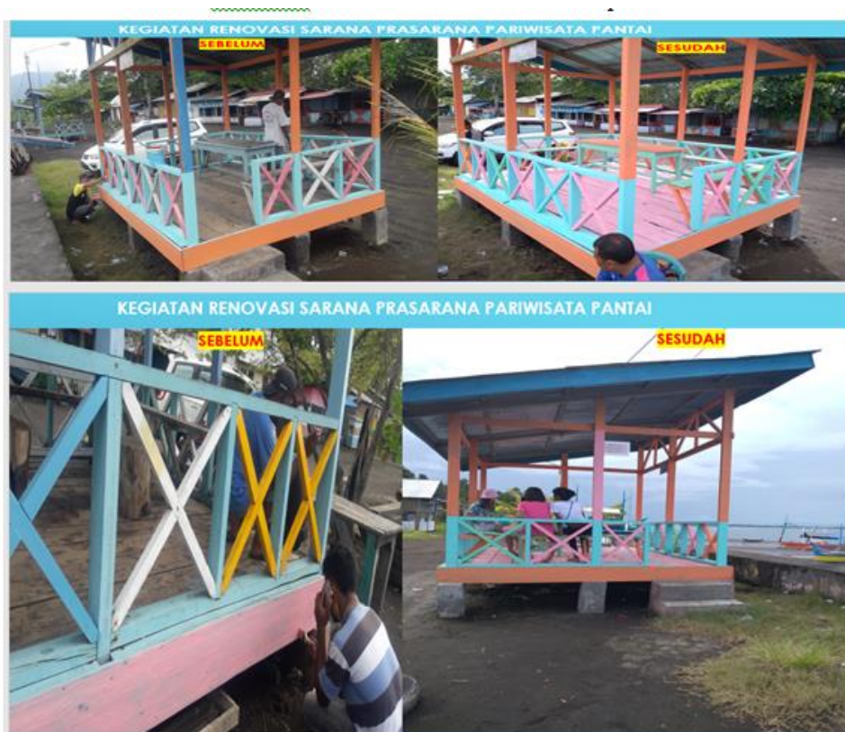
Gambar 3. Penataan dan Renovasi Sarana prasarana

Pengadaan dan renovasi Sarana prasarana wisata sampai saat ini telah dilaksanakan berupa kegiatan renovasi sarana prasarana 4 Gazebo, meja dan kursi 4 buah, dan Pengadaan sarana kebersihan seperti perlengkapan Sapu. Kegiatan renovasi sarana prasarana pariwisata pantai dilakukan oleh Tim PKM, pengurus Bumdes, dan pemilik warung/kios untuk melakukan pengecatan gazebo, meja, dan kursi. Untuk pembuatan meja dan kursi dibuat oleh tukang kayu. Penataan dan renovasi sarana prasarana pariwisata juga merupakan aspek penting dan juga bagi sumber daya pendukung lainnya seperti sumber daya manusia yang membuat sarana pendukung pariwisata pantai. Memahami pentingnya peranan sumber daya manusia dalam pengembangan desa wisata dan juga agar masyarakat lokal dapat memperoleh manfaat (Suprastayasa, 2020). Pengembangan pariwisata khususnya sarana dan prasarana pariwisata merupakan sebuah proses peningkatan nilai dalam berbagai aspek bidang pariwisata terutama ketersediaan objek daya tarik wisata serta sarana dan prasarana (Wahyu Narendra Kusuma Wardana, 2018).